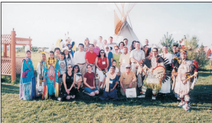
Les participants au séminaire de l'Ouest en visite à Hobbema,